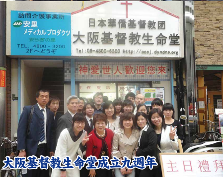
大阪基督教生命堂成立九週年 主日禮拜