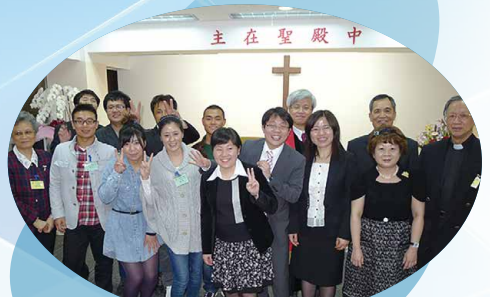
大阪基督教生命堂成立10週年