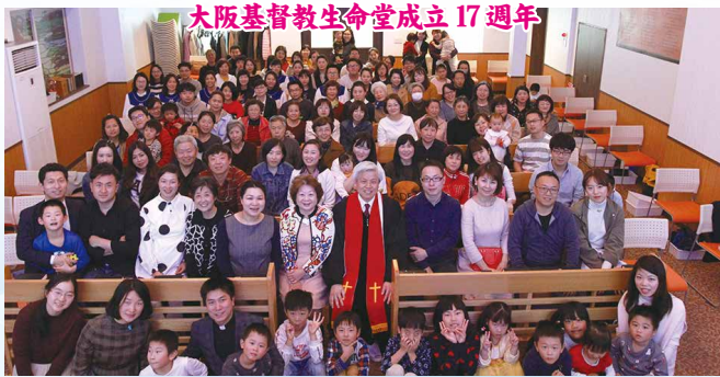
大阪基督教生命堂成立17週年