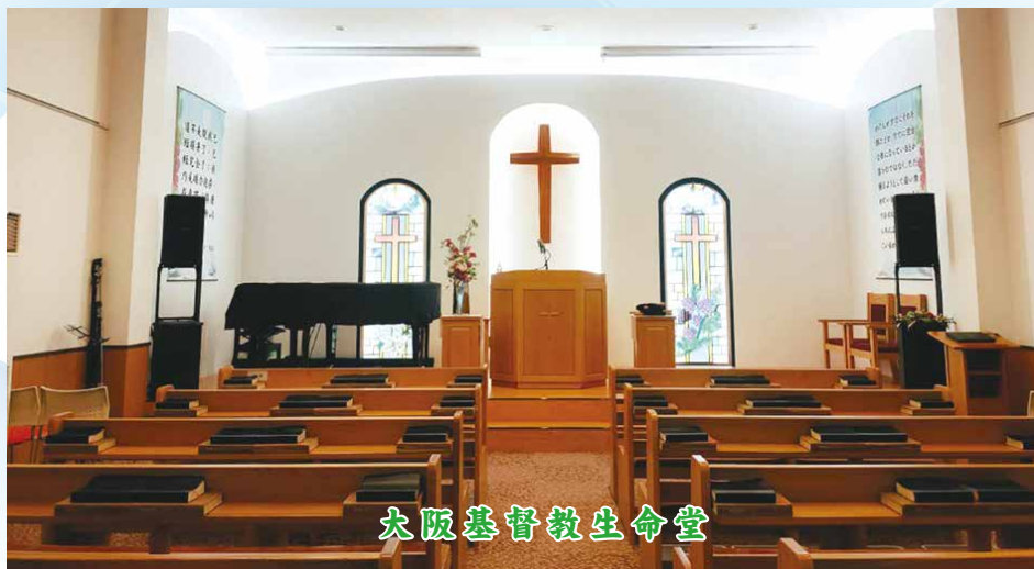
大阪基督教生命堂