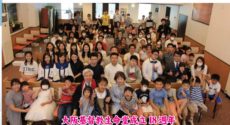
大阪基督教生命堂成立 18週年