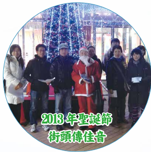
2013年聖誕節街頭傳佳音