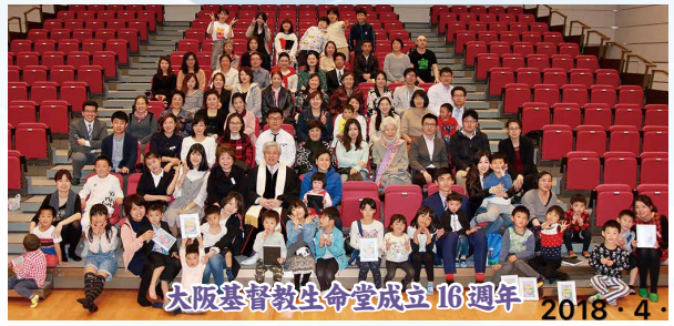
大阪基督教生命堂成立16週年 2018.4