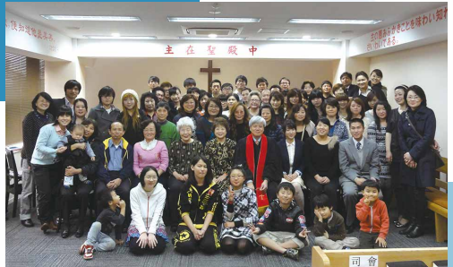
大阪基督教生命堂成立11週年