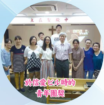
於信愛此時的青年團契